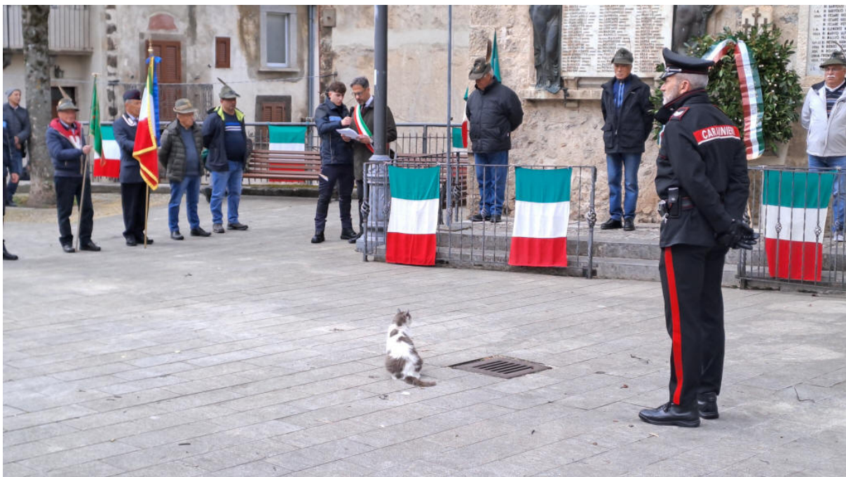
Scanno, 25 aprile 2024 – Celebrazione della Festa della Liberazione