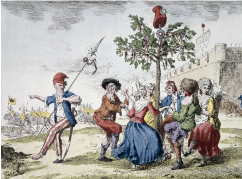
L'Albero della Libertà Istituto Storico Sannio Telesino