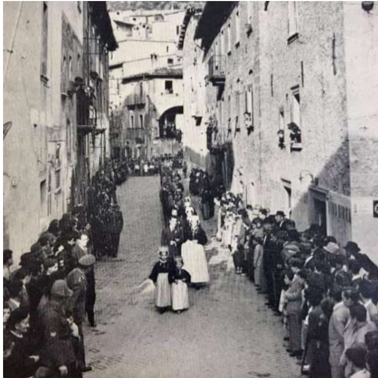
Scanno, 1953 A destra sono ben visibili tre speroni risalenti all'epoca dei terremoti del 1700