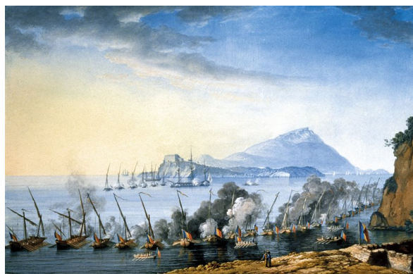
Battaglia tra la flotta repubblicana e quella anglo-borbonica, nel canale di Procida, nel 1799.