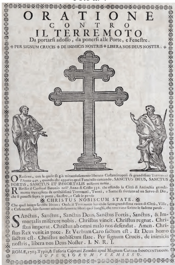
Esempio di Foglio di Orazione contro il terremoto, fra i molti diffusi a seguito dei terremoti del 1703

La sequenza colpì un vasto territorio pressoché equamente diviso tra la giurisdizione dello Stato Pontificio e quella del Regno di Napoli. Dalla documentazione disponibile risulterebbe che gli interventi delle due amministrazioni ebbero modalità e tempistiche diverse. Molto rapida nell'intervenire fu la Santa Sede, direttamente coinvolta a livello centrale sia nelle misure di emergenza nelle località danneggiate, che nelle misure di ristoro spirituale. Con un certo ritardo si mosse il governo del Regno di Napoli, forse per la distanza dall'area epicentrale, o forse per una maggior lentezza della macchina amministrativa, unita al fatto che il Regno versava in un lungo periodo di crisi dovuta alla guerra di successione di Spagna.