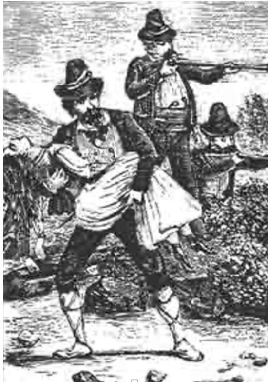
Dal Periodico Due Sicilie 09/1999