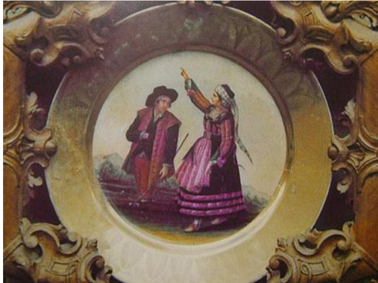
Antichi costumi femminili e maschili di Scanno Piatto prodotto dalla Real Fabbrica di Capodimonte nel secolo XVIII.