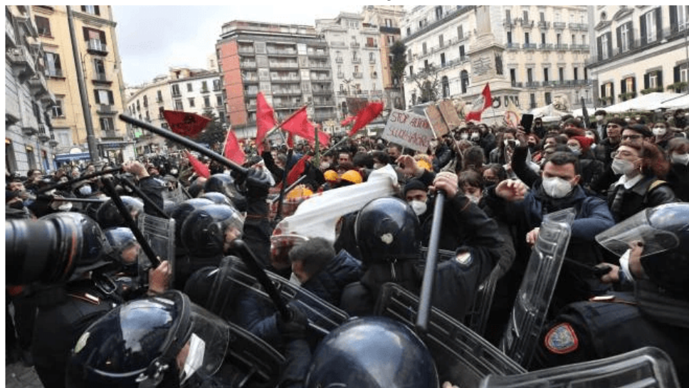
Napoli, 13 febbraio 2024 – Da Il Desk Spintoni e manganellate al presidio davanti alla sede Rai