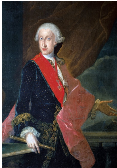
Ritratto del re Ferdinando IV di Napoli, opera di Francesco Liani. Il sovrano era noto presso il popolo come Re Lazzarone o Re Nasone. Museo Provinciale Campano, Capua